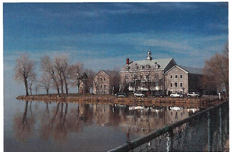
Le couvent fut construit en 1867. L'ajout des deux ailes, une de chaque côté, date de 1962.