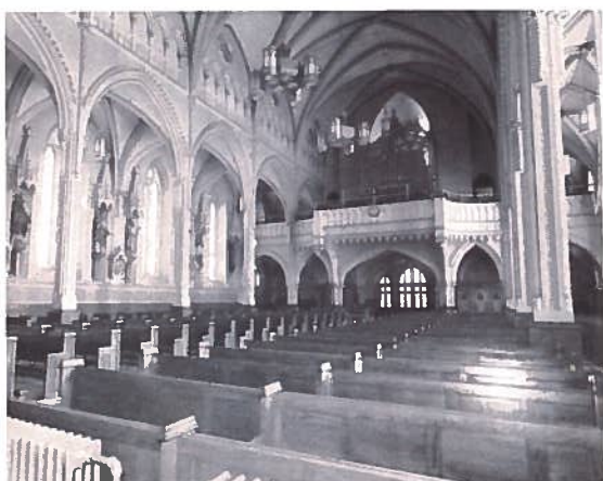
Vue intérieure de l'église (prise du sanctuaire)