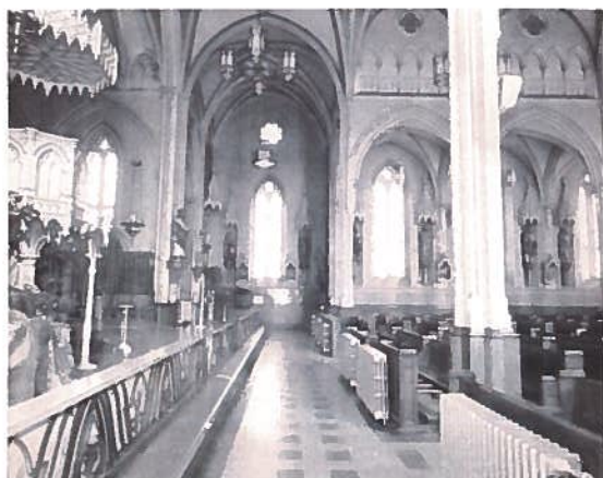
Vue intérieure de l'église (prise du transept gauche)