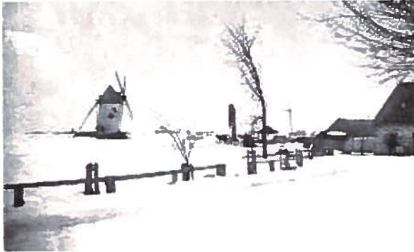
Le moulin et l'ancienne croix en 1867, avant la construction du couvent actuel.

En 1660, les premiers blancs arrivent sur les bords du lac St-Louis et la colonisation s'amorce à Lachine et à Ste-Anne. Quelques années plus tard, soit en 1698, Pointe-Claire commence véritablement à se développer. Il est permis de croire que des missionnaires de Lachine et de Ste-Anne fournissent les services spirituels à toute la population de l'Ouest de l'île jusqu'en 1712. L'année 1705 marque la construction du premier presbytère. Malgré le fait que les archives paroissiales ne possèdent aucune illustration de ce dernier, les registres de la paroisse démontrent qu'il a servi de lieu au premier baptême célébré à Pointe-Claire par le curé Vilermaula de la paroisse de Lachine. Devenu désuet, ce presbytère fut démoli en 1848 et remplacé la même année par un second. Il fut ensuite restauré à plusieurs reprises, notamment en 1912, pour lui ajouter un deuxième étage et en 1954 pour le moderniser.