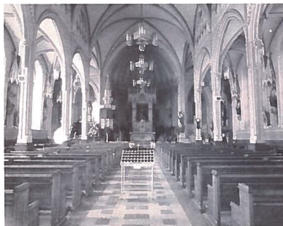
Vue intérieure de l'église (prise de l'entrée)